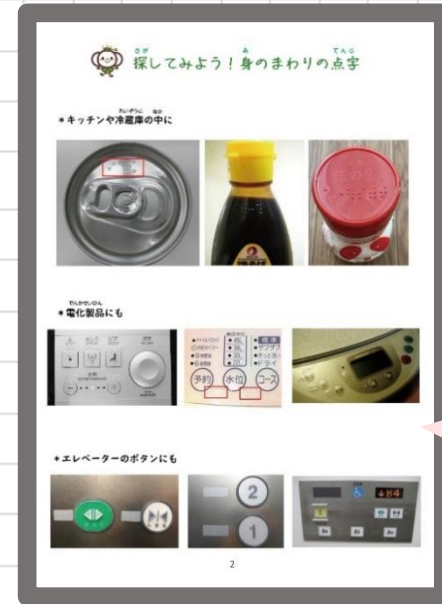
身の周りの点字をご紹介します