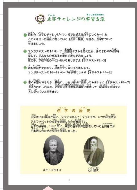
点字の歴史についても掲載