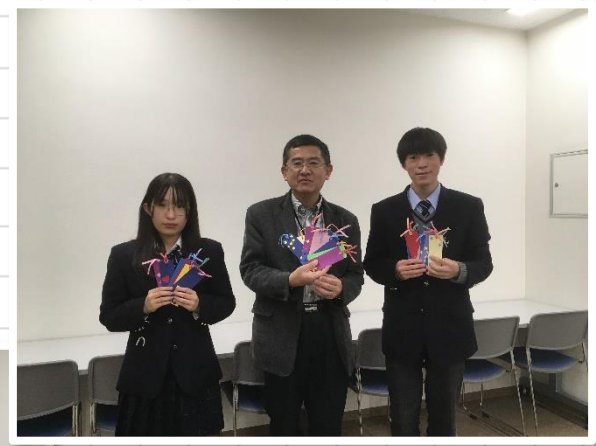
真砂中央図書館での贈呈式の様子。