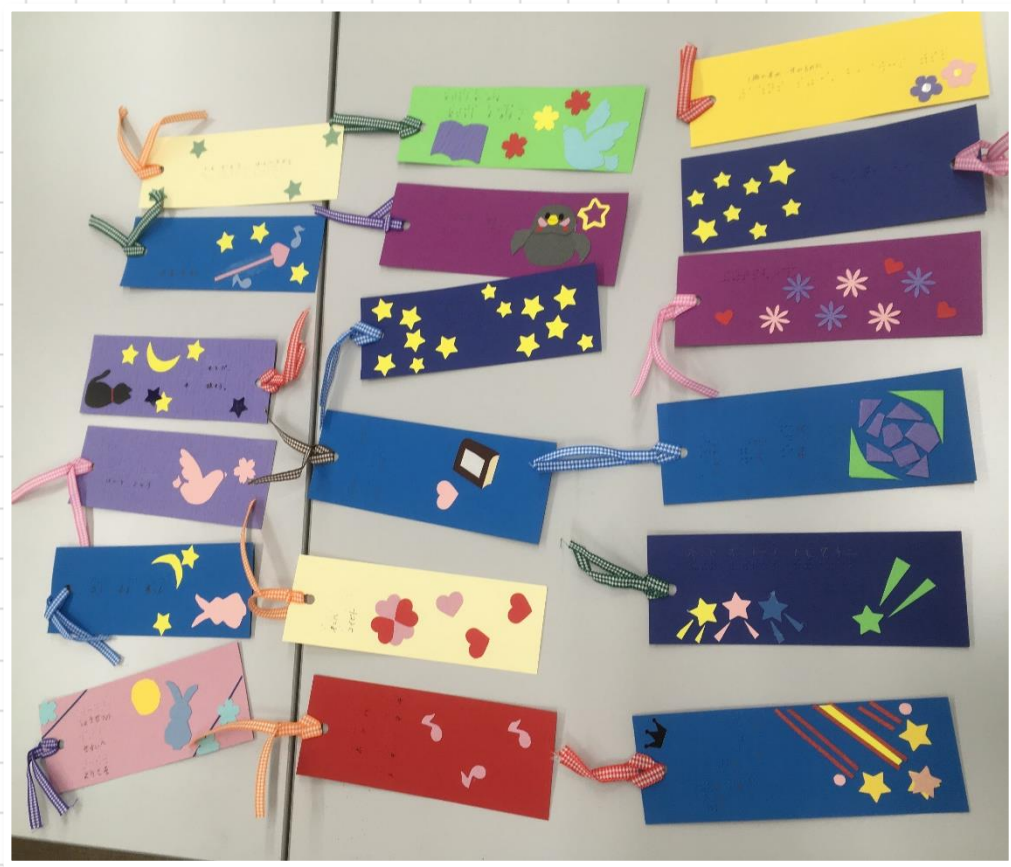
こんなにたくさんの作品が寄贈されました！どのしおりも素敵ですね