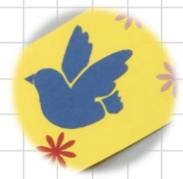
作成してから1年遅れのしおりのプレゼント。図書館を訪れる皆さんに喜んでもらえるといいですね。